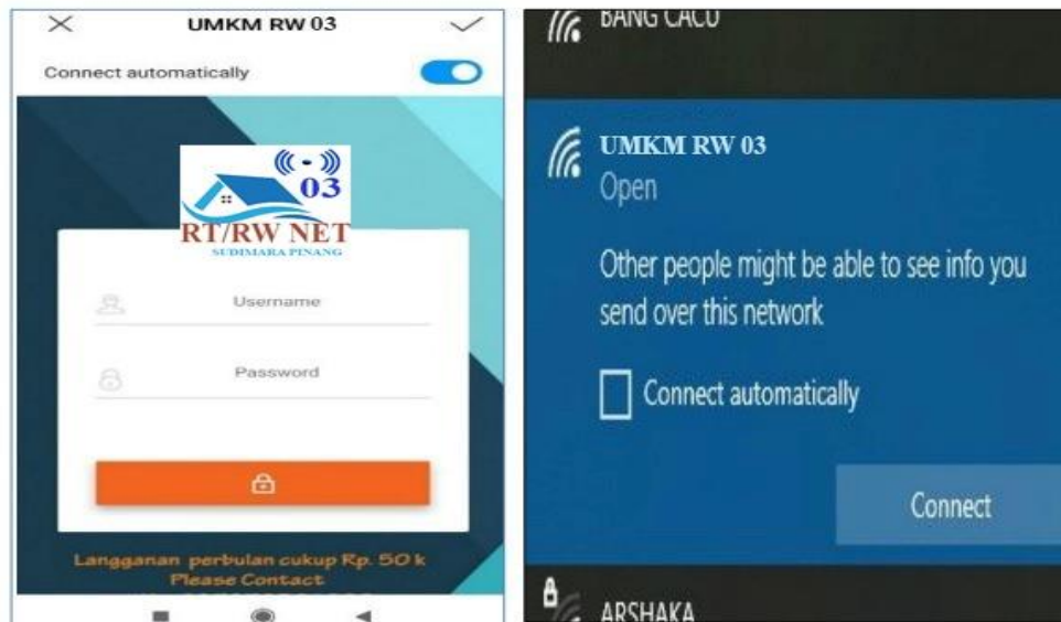
Gambar 3. Tampilan Aplikasi