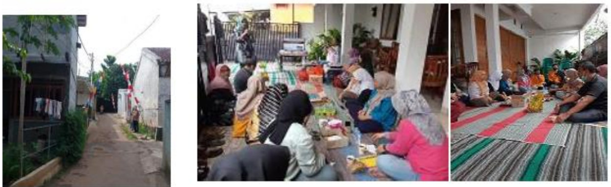
Gambar 2. Pelatihan di Lingkungan