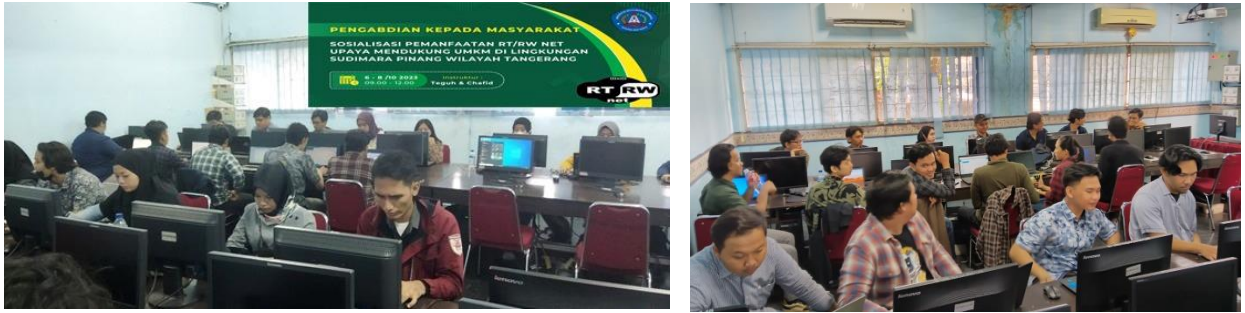
Gambar 1. Pelatihan di Kampus